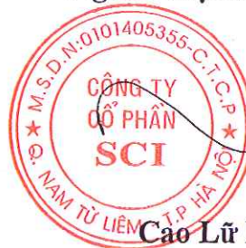
Cao Lữ Phi Hùng