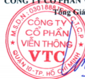
Lê Xuân Tiến

Các thuyết minh từ trang 7 đến trang 29 là bộ phận hợp thành của Báo cáo tài chính này.