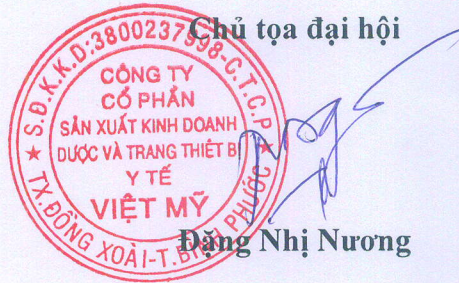
Đặng Nhị Nương