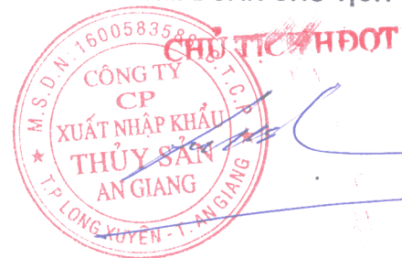
CHÂU DUY CƯỜNG