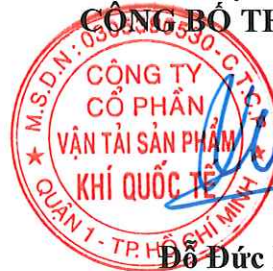
Đỗ Đức Hùng