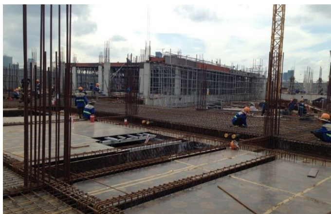
Lakeview 1: Khu nhà 4 tầng đang xây sàn tầng 2