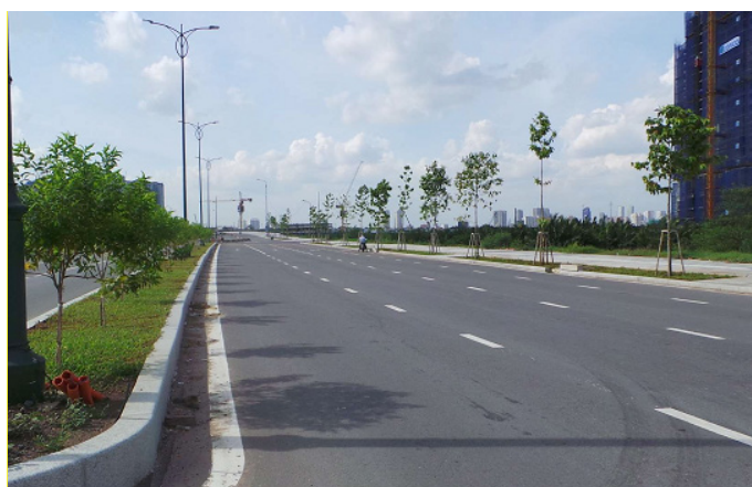
Trồng cây xanh đường R14

Đến nay, công ty đã hoàn thành thi công hầu hết các hạng mục đường chính và đang triển khai thực hiện các công trình phụ trợ như trồng cây xanh, lát vỉa hè... Kế hoạch thi công trong Quý 3 sẽ bao gồm việc (i) tiếp tục thi công hoàn thiện mặt đường R14, (ii) thi công hạ tầng, vỉa hè, đường nội bộ, (iii) bơm hút và đắp cát gia tải, (iv) tiếp tục bơm cát các tuyến đường nội bộ.