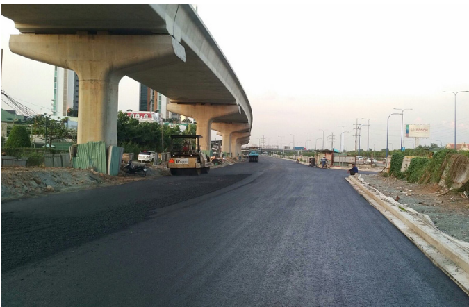
Thi công thảm bê tông nhựa (Đoạn từ đường Võ Trường Toản đến đường Giang Văn Minh)

Đến cuối Q2/2017, dự án đã hoàn thành khoảng 72% tổng khối lượng thi công. Trong kỳ, công ty vừa khởi công gói thầu xây dựng hầm chui qua nút giao thông Trạm 2 với tổng mức đầu tư dự kiến khoảng 220 tỷ đồng.