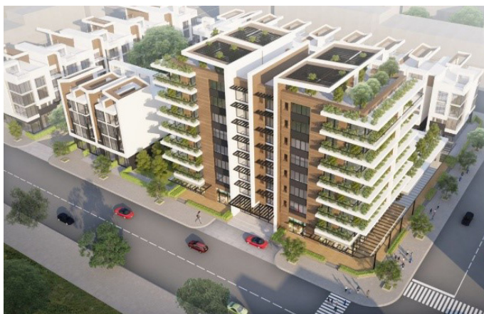
Thiết kế 3D dự án Lakeview 3

Bên cạnh đó, CII và đối tác chiến lược Hong Kong Land đã thống nhất phương án quy hoạch 1/500 cho một số dự án nằm trong quỹ đất nhận được từ dự án BT Thủ Thiêm. Bản quy hoạch được lập bởi công ty tư vấn thiết kế danh tiếng DP Architects từ Singapore.