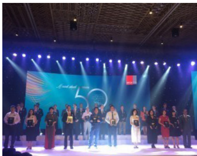
Đại diện CII tham dự lễ trao giải Top 50 công ty kinh doanh hiệu quả nhất Việt Nam (ngày 9/6/2017)

Việc CII luôn có tên trong danh sách các công ty niêm yết uy tín nhất Việt Nam bình chọn bởi các tổ chức danh tiếng đã khẳng định thành công của công ty trong hoạt động kinh doanh và trong việc xây dựng, phát triển uy tín trên truyền thông Việt Nam trong thời gian vừa qua.