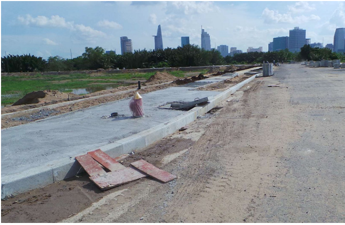
Thi công vỉa hè đường R10