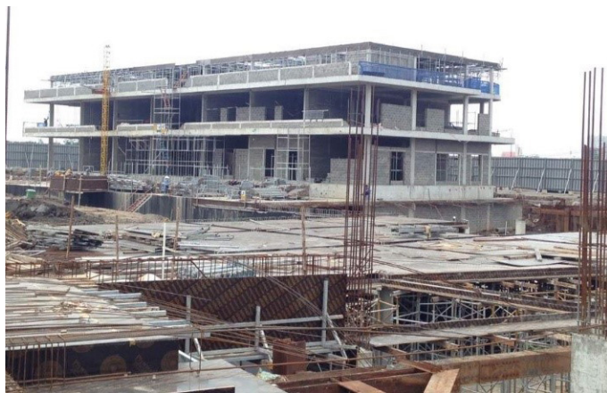
Lakeview 1: Khu nhà 2 tầng đã hoàn thành phần thô

Đến cuối Q2/2017, dự án đã hoàn thành khoảng 60% khối lượng thi công, dự kiến đầu năm 2018 giao nhà. Hiện tại, Công ty đã hoàn thành xây dựng phần thô khu nhà 2 tầng và đang xây sàn tầng 2 cho khu nhà 4 tầng.