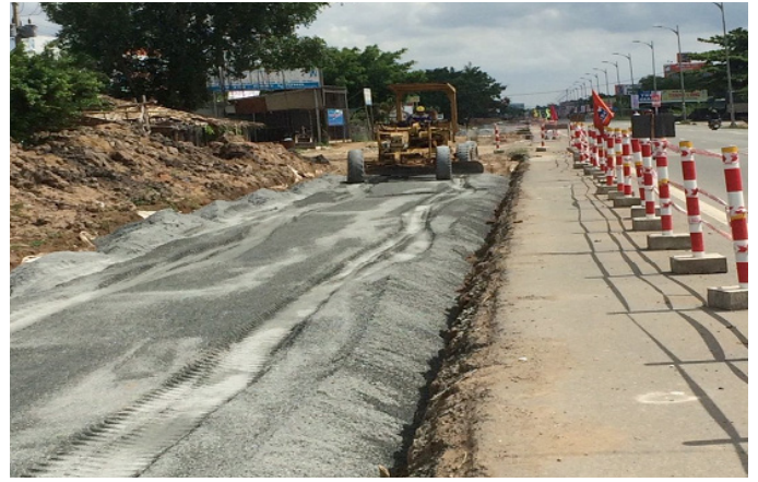
QL60: Thi công san đá mi