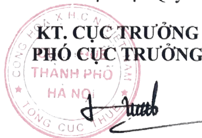
Viên Viết Hùng

- Lưu: VT; Phòng TTra thuế số 1 (03). (6/4)